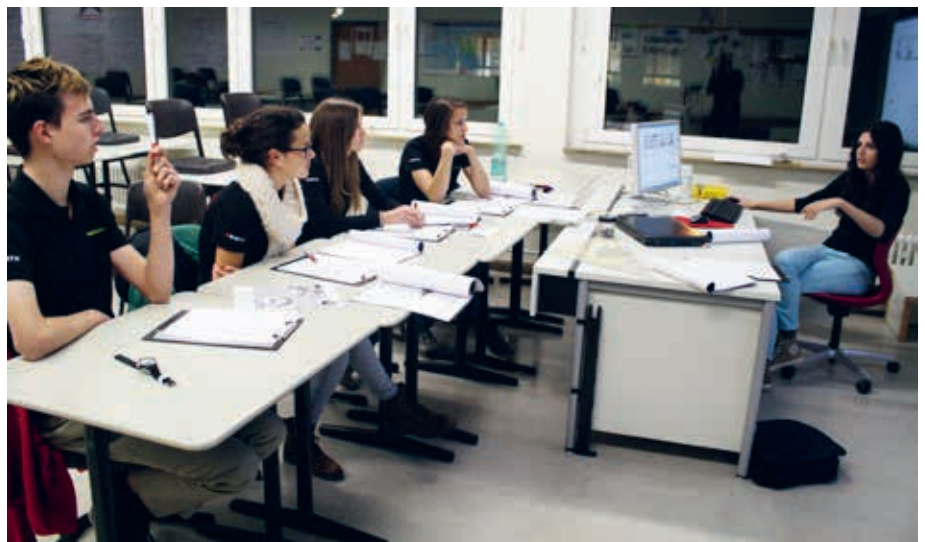
Artikel + Foto: Klaus Schenck